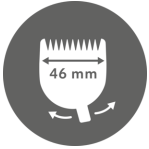
MAGIC BLADE 0,7 - 3 mm