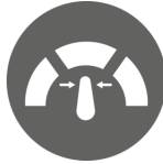
Constant cutting power