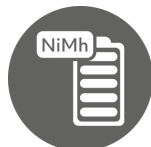
Cordless Operation 1h25 use | 2h charge